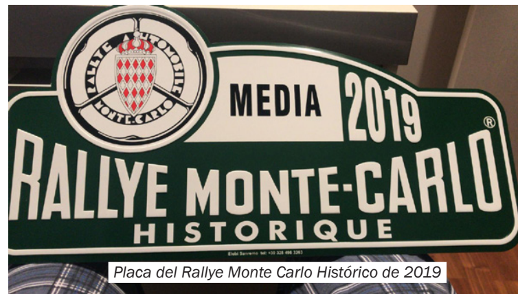
Placa del Rallye Monte Carlo Histórico de 2019

Con todo el horizonte dominado por la blancura de la nieve giramos hacia el sur por la comarcal D9 que discurre paralela al río Volane, afluente del Ardèche, y que desemboca en el Ródano, en dirección a Antraigues sur Volane. Del paisaje habían desaparecido los colores, ahora sólo queda el negro, el blanco salpimentados de gris. El silencio es absoluto. Estoy preocupado porque hay que cruzar el puerto de montaña de Saint Agrève. Paramos en un recodo de la carretera con cuidado pues la nieve suele ocultar desniveles peligrosos y ponemos las cadenas al vehículo, no llevamos ruedas de clavos que tanta seguridad ofrecen en conducción por nieve y hielo. Cuando comenzamos a subir el puerto comienza a nevar y la temperatura ha descendido a nueve grados centígrados bajo cero. A la derecha se