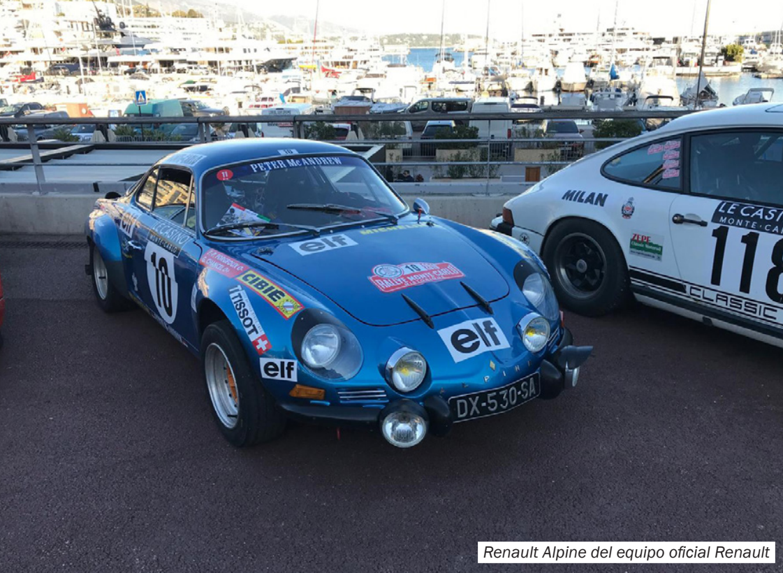
Renault Alpine del equipo oficial Renault