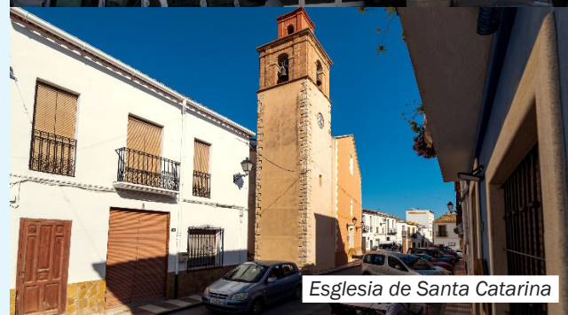
Esglesia de Santa Catarina