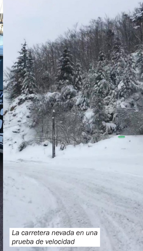
La carretera nevada en una prueba de velocidad