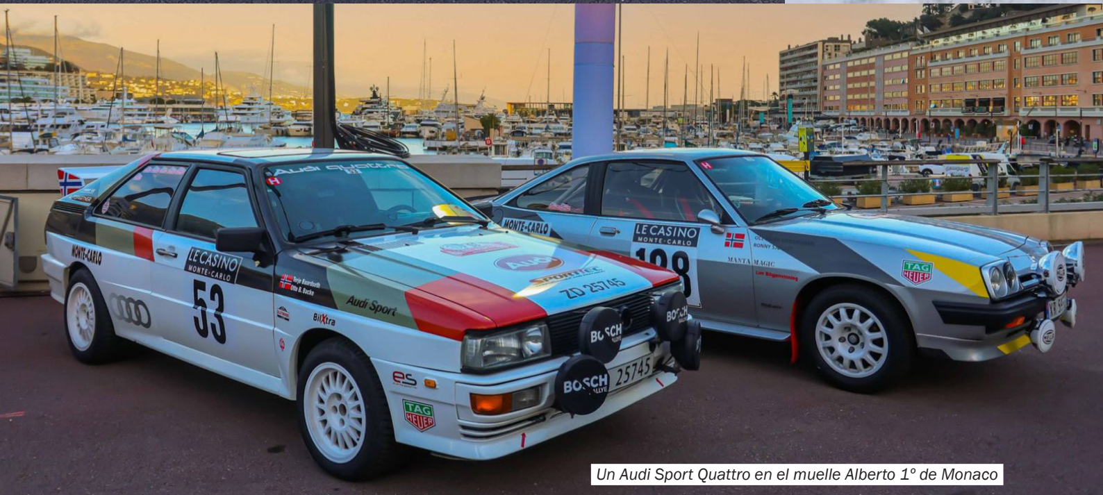
Un Audi Sport Quattro en el muelle Alberto 1º de Monaco

Fèlicien muy suave. Fue una explosión de sabores muy diferente a nuestros quesos manchegos. Desgraciadamente el vino era beaujolais y además caliente. El beaujolais es un vino cosechero que se toma frío para dulcificar su astringencia. Tomarlo caliente es una temeridad pero sienta bien cuando la temperatura exterior es de menos nueve grados centígrados. En Francia se dice que el Ródano tiene tres afluentes: La drôme, la Saône et le beaujolais. Los ríos en Francia son femeninos y no existe el río beaujolais, pero se bebe tanto beaujolais en toda Francia el tercer domingo de noviembre que se le considera un río más.