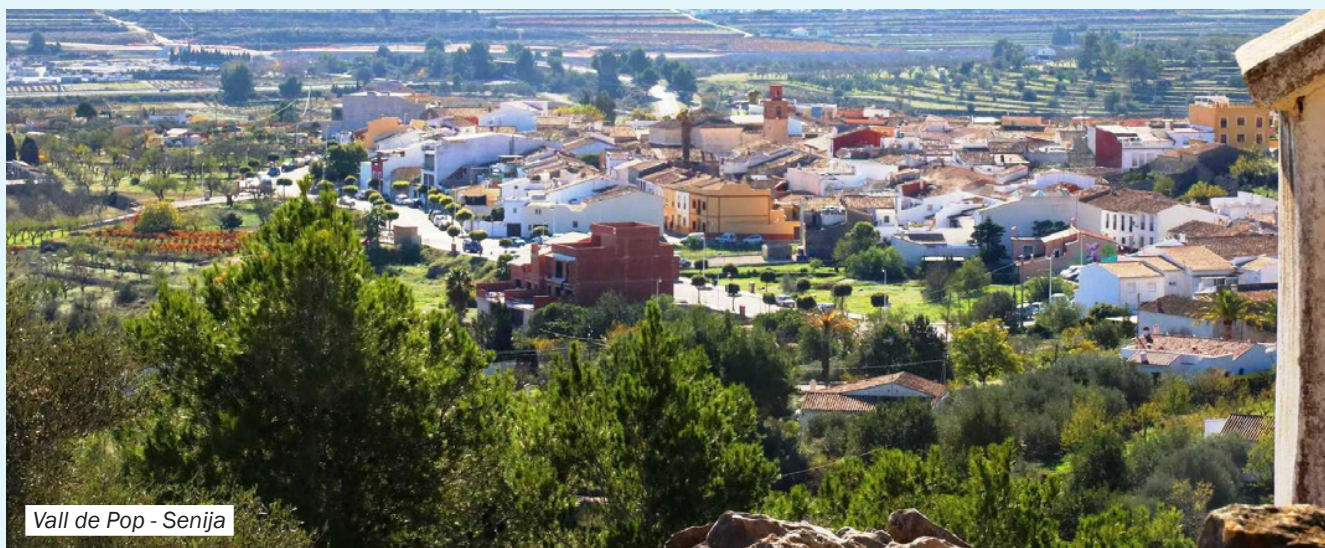
Vall de Pop - Senija

La historia del pueblo de Senija, como muchos de los situados en el Valle del Pop, comienza con los árabes. Su nombre, Sinhadga, es de origen árabe. Este asentamiento estaba formado por una tribu berberisca que pobló la planicie de la pequeña montaña en la que hoy en día se ubica el pueblo de Senija.