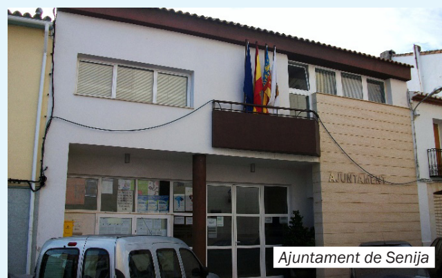
Ajuntament de Senija

riuraus y su gente son de especial interés para los visitantes, ya que podrán gozar de comidas típicas como las famosas pelotas de puchero, los embutidos, las cocas y el “mullador” en un marco típicamente mediterráneo. Por eso os invitamos a pasear por sus calles y conversar con la gente del pueblo, sobre todo las noches de verano, donde a las puertas de las casas sacan las sillas y disfrutan “a la fresca”.